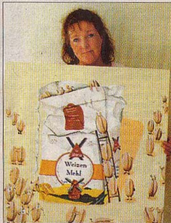
Weizenkörner wollen in die Tüte: Dieses Bild hat Gesa Tams-Koll für Gut Basthorst gemalt.

BASTHORST/GRABAU – Sie malt Blumen und Früchte, Tiere und Häuser, aber auch Trecker und eine Tüte Mehl. Häufig lässt die Grabauerin Gesa Tams-Koll dabei ihrem Humor freien Lauf. „Ich male sehr gern persönliche Bilder, bei denen ich meine Fantasie spielen lassen und witzige Ideen unterbringen kann“, sagt die 40-Jährige.